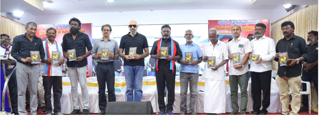
ஈழத்தமிழரின் உரை தொகுப்பான 'சிறுத்தைகள் இருக்கும்வரை பெரியாரியத்தை வீழ்த்த முடியாது' நூல் வெளியீடு

நிறைய பாடியிருக்கிறேன். ஒன்றையும் நான் தொகுத்து வைக்கவில்லை. 'விடுதலைப் புலிகள்' என்கிற பெயரில் கையெழுத்து ஏட்டை மூன்று மாதங்கள் நடத்தினேன். அதன்பிறகு எனக்கு மஞ்சள் காமாலை வந்ததால் அதைக் கைவிட்டு நேர்ந்துவிட்டது.