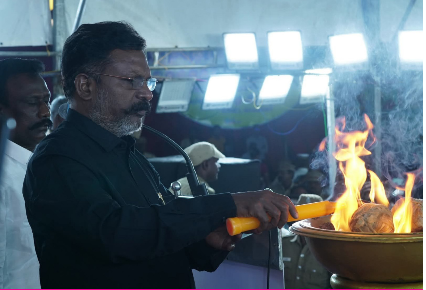
மாவீரர்களை நினைவுகூர்ந்து ஈகைச் சுடரேற்றும் எழுச்சித்தமிழர்

இயக்கம். அமெரிக்காவில் இரட்டைக் கோபுரம் இடிக்கப்படுகிறது. அதன்பிறகு உலக அரசியல் முற்றாக மாற்றம் பெறுகிறது. வேறு பரிணாம நிலையை எடுக்கிறது. இரட்டைக் கோபுரம் இடிப்புக்குப் பிறகு அரசியலின் திசைவழியே மாறிப்போனது. அமெரிக்க ஆதரவு நாடுகள் ஒன்றுசேர்ந்து 'உலக அளவில் பயங்கரவாதத்தை நாங்கள் ஒழித்துக்கட்டப் போகிறோம்' என்று ஆவேசப்பட்டன. இந்தச் சூழலில்தான் அல்கெய்தா உள்ளிட்ட பயங்கரவாத அமைப்புகளுக்கு எதிரான ஒரு யுத்தத்தைத் தொடுக்க வேண்டும் என்று அமெரிக்கப் பேரரசு முடிவு செய்து தனது ஆதரவு நாடுகளையெல்லாம் திரட்டி, பயங்கரவாத இயக்கங்களின் பட்டியலைத் தயார் செய்தது. 20க்கும் மேற்பட்ட பட்டியலில் விடுதலைப்புலிகள் இயக்கத்தின் பெயரும் இடம்பெற்றது. இந்தக் கோணத்தில் யாரும் இதைப் பேசுவதில்லை. விடுதலைப் புலிகள் இயக்கத்திற்கு எதிராக இந்தியா மட்டுமல்ல; உலகத்தின் பல நாடுகளில் தடைவிதிக்கப்பட்டன.