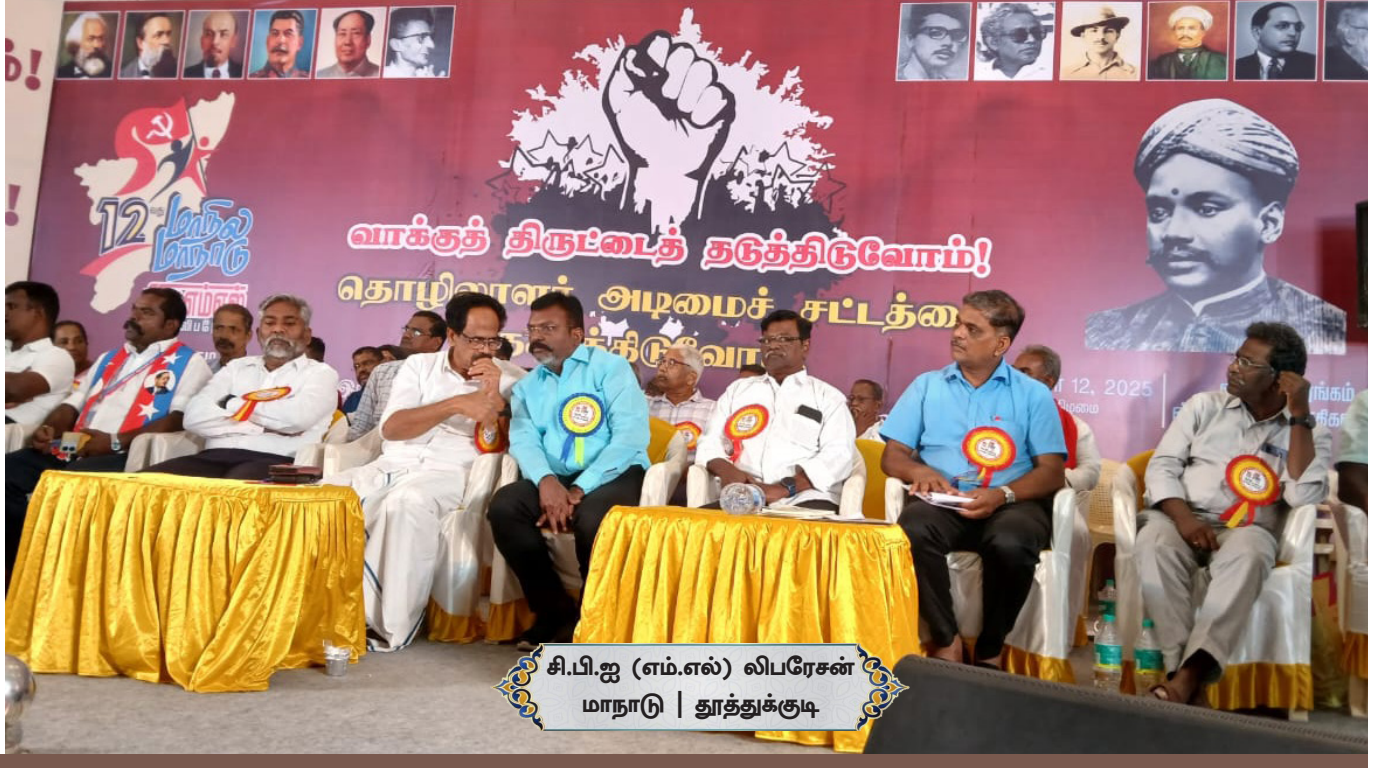
சி.பி.ஐ (எம்.எல்) லிபரேசன் மாநாடு | தூத்துக்குடி