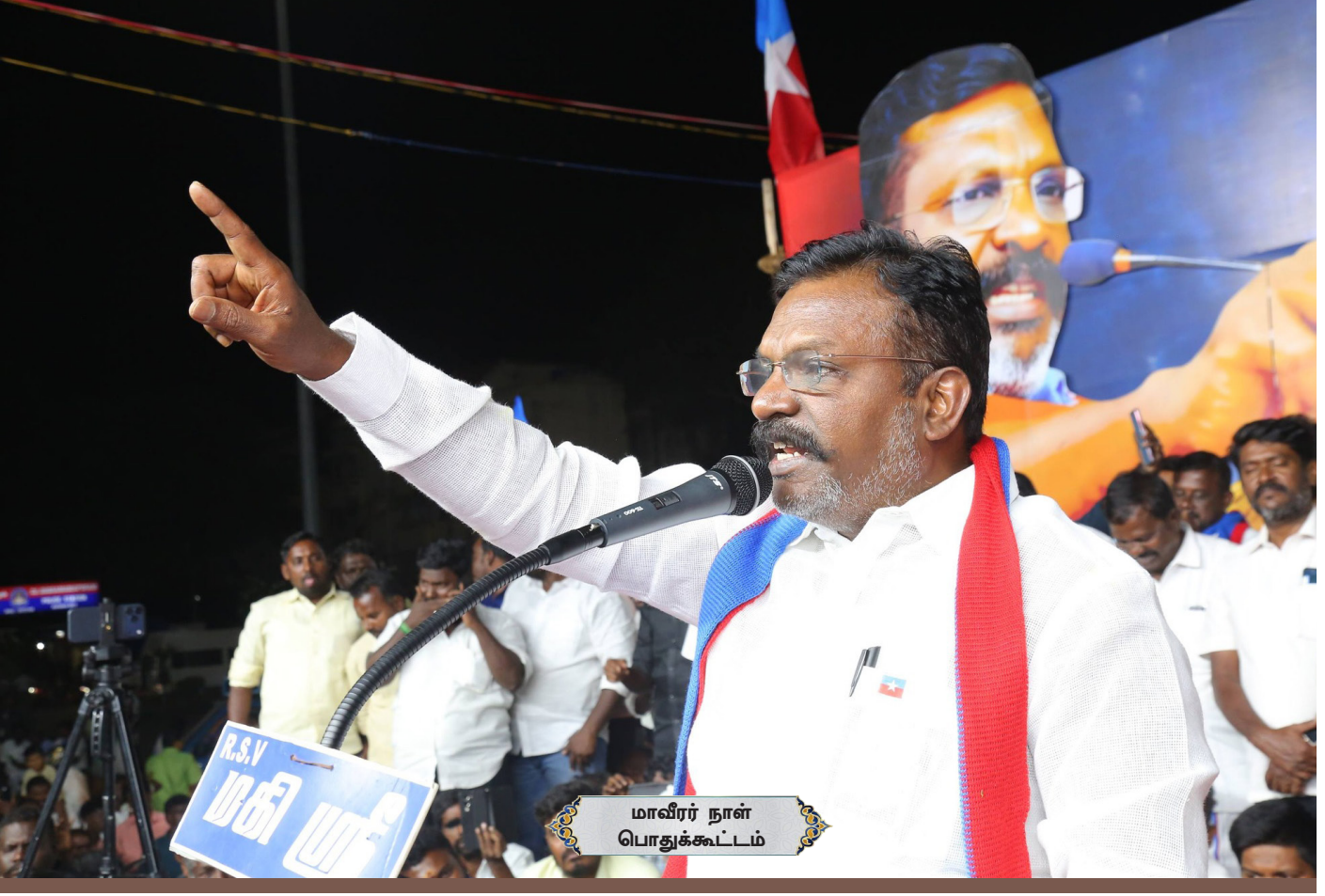
மாவீரர் நாள் பொதுக்கூட்டம்

சிறுத்தைகள் இருக்கும் வரையில் காவிகளின் கனவு பலிக்காது: