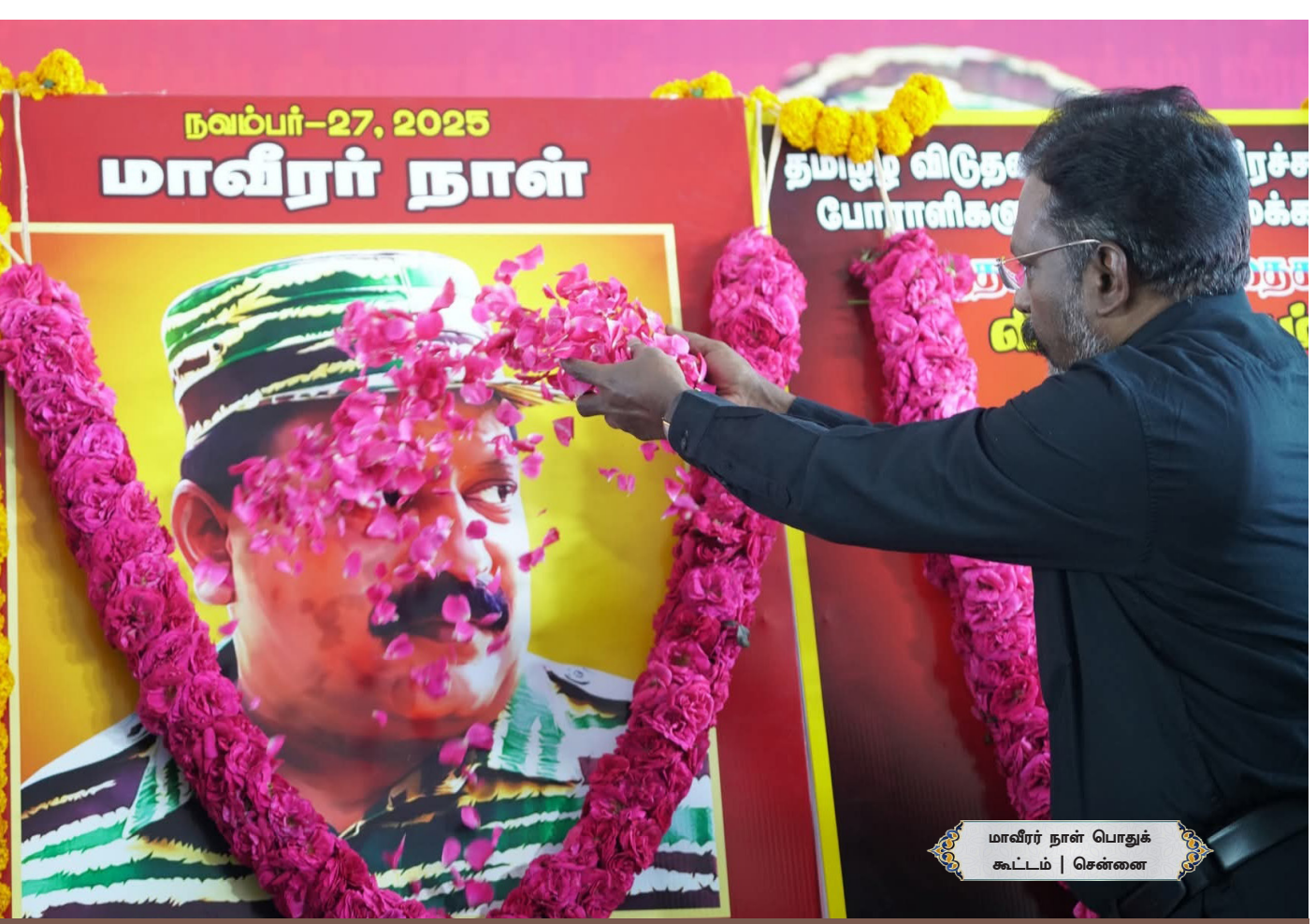
மாவீரர் நாள் பொதுக் கூட்டம் | சென்னை